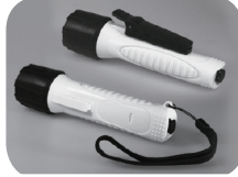
Zubehör / accessories