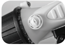
Verschluss & Ventil / fastener & valve