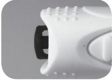
Mechanischer Schalter / mechanical switch